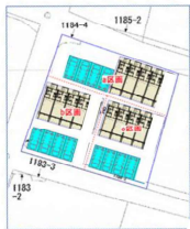
配置図はイメージとなります。